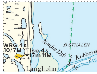
Udsnit kort / Block chart 108

Søkortrettelser / Chart Corrections 39/577 2020