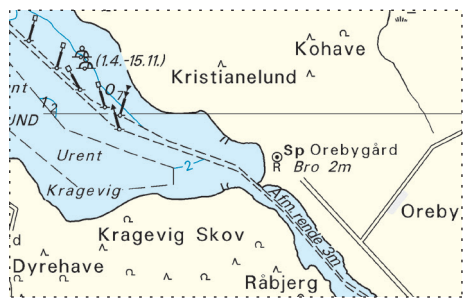
Udsnit kort / Block chart 160

Søkortrettelser / Chart Corrections 3/6 2023